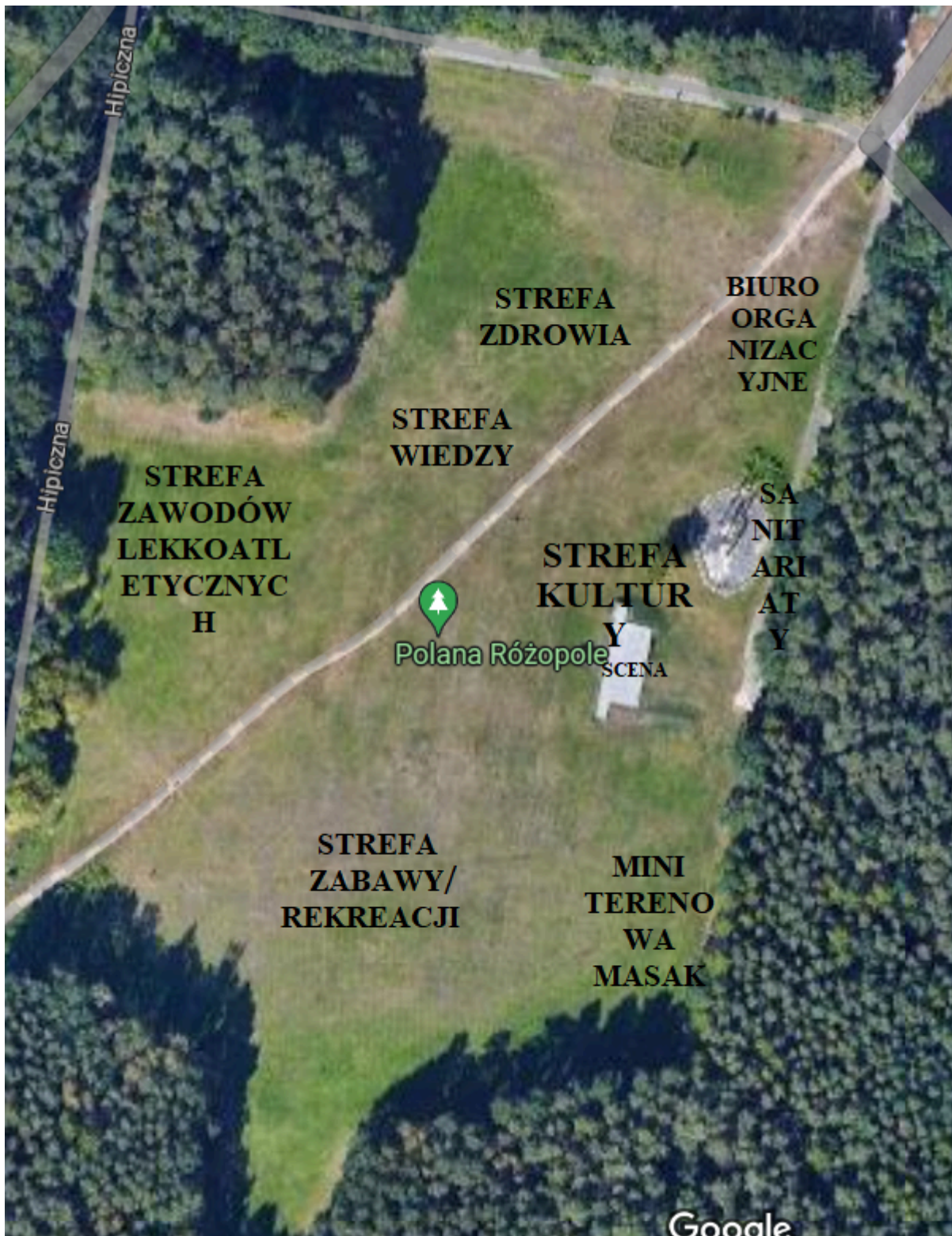
POLANA RÓŻOPOLE LPKiW ul.Gdańska 173-175