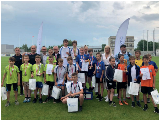
Trójbój LA Finał Wojewódzki, Wąbrzeźno 2022