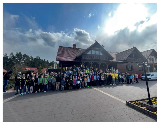
Szachy Drużynowe w Fojutowie – Licealiada 19-22.04.2023, Igrzyska Dzieci, Igrzyska Młodzieży Szkolnej – 25-28.04.2023