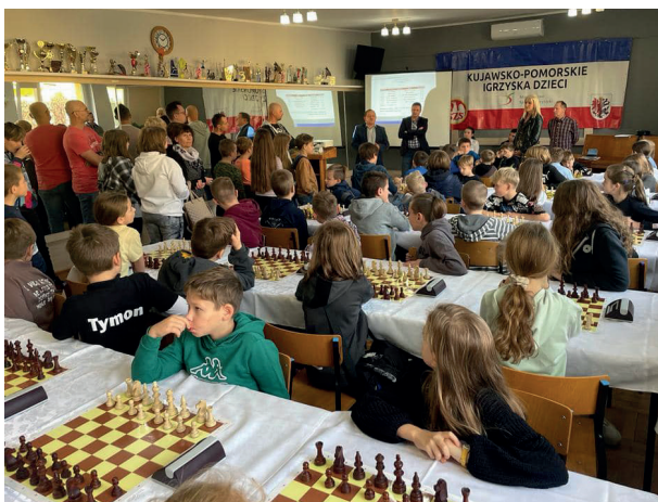
Szachy Igrzyska Dzieci Finał Wojewódzki, 2022