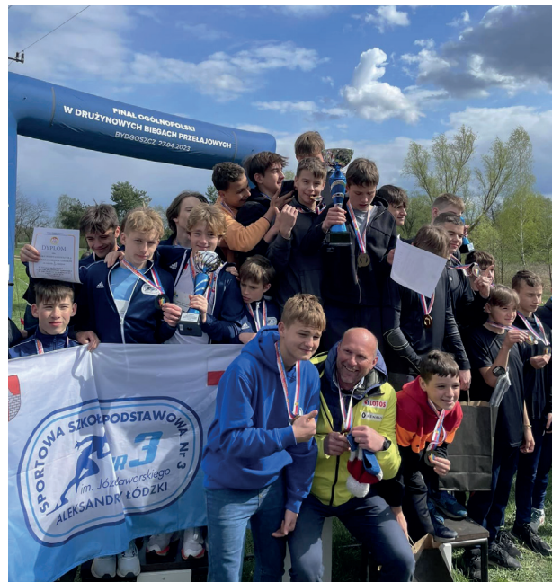
Drużynowe biegi przelajowe - Bydgoszcz, LPKiW Myślęcinek, 27.04.2023