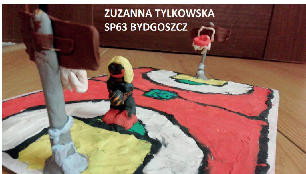
ZUZANNA TYLKOWSKA SP63 BYDGOSZCZ