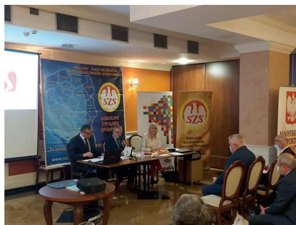
XVII Ogólnopolski Sejmik Szkolnej Kultury Fizycznej 4-7.11.2021 Supraśl