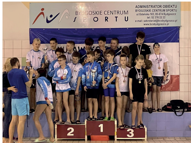
Pływanie Drużynowe Igrzyska Dzieci Dziewcząt i Chłopców, Bydgoszcz 29.11.2022