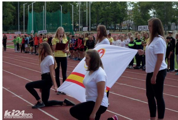
ID w Czwórboju LA dziewcząt i chłopców, który odbył się w 14-15 czerwca 2018 r w Inowrocławiu.