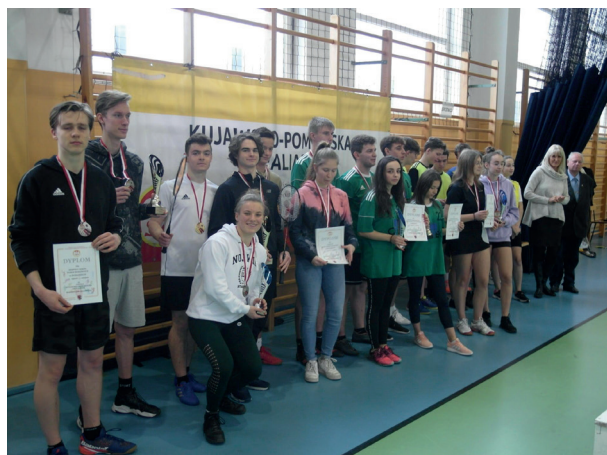
Badminton Licealiada, 13.12.2021 Sepólno Krajeńskie