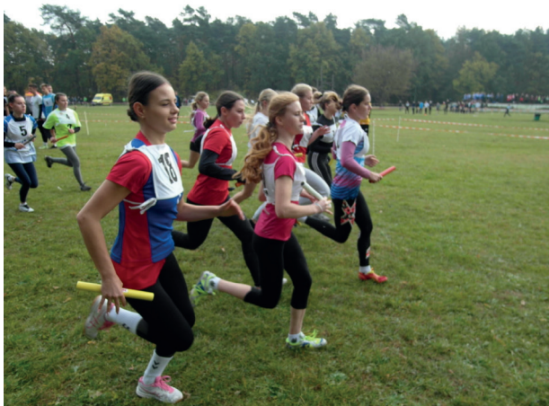
Sztafetowe biegi przelajowe, Myslęcinek 2021