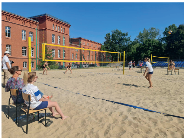
Igrzyska Młodzieży Szkolnej Siatkówka Plażowa Dziewcząt i Chłopców Finał Wojewódzki, Toruń 14.06.2023