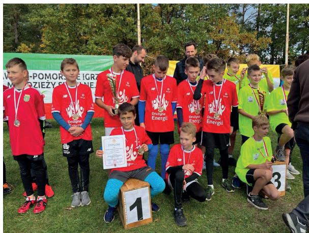
Sztafetowe biegi przelajowe, Myslęcinek 2022