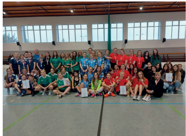
Unihokej Licealiada Dziewczęta, 8.12.2022