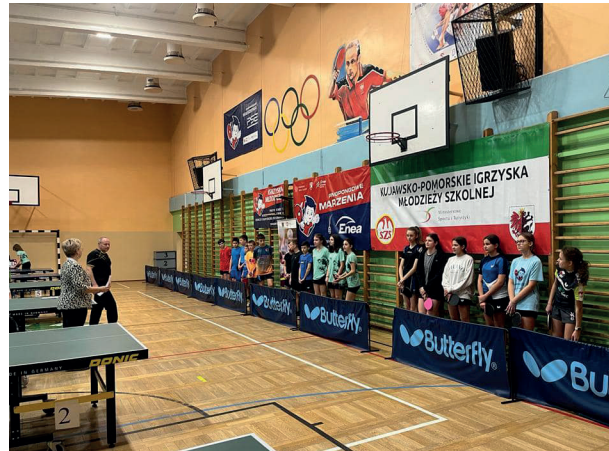
Tenis stołowy Igrzyska Młodzieży Szkolnej Dziewcząt i Chłopców, Bydgoszcz 1.12.2022