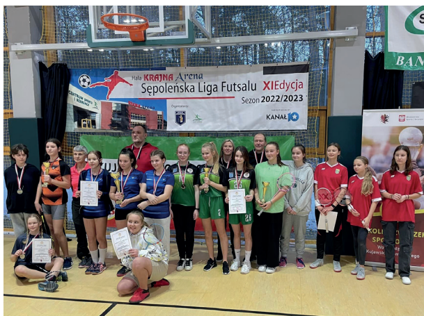
Badminton IMS, 13.12.2022 Sepólno Krajeńskie