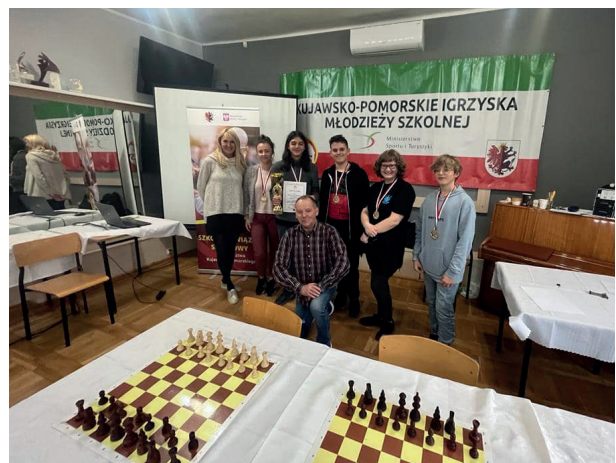
Szachy Igrzyska Młodzieży Szkolnej, 15.11.2022