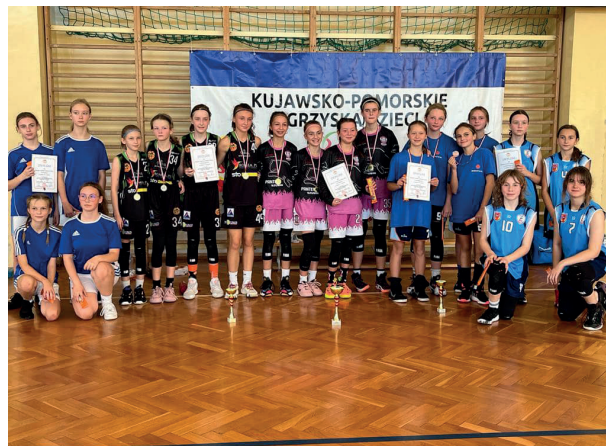
Koszykówka 3x3 Igrzyska Dzieci Finał Wojewódzki, 07.10.2022