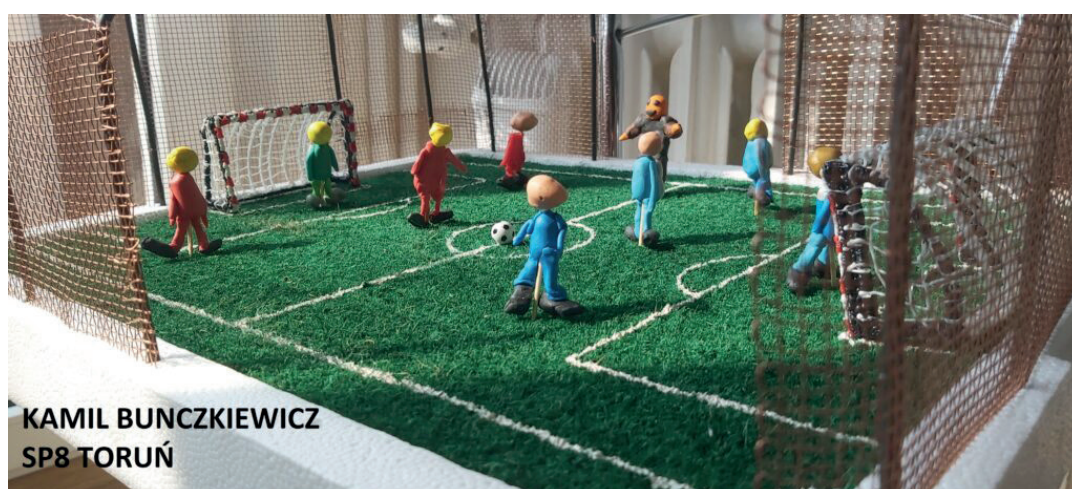
KAMIL BUNCZKIEWICZ SP8 TORUŃ