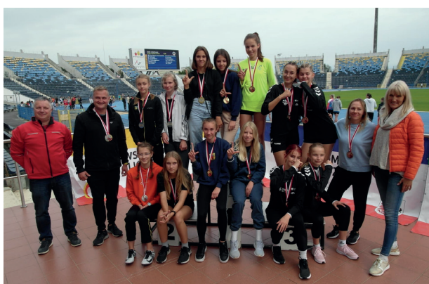
Festiwal sztafet 2021