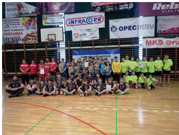
IMS Piłka Ręczna Chłopców, 25.01.2023 Grudziądz