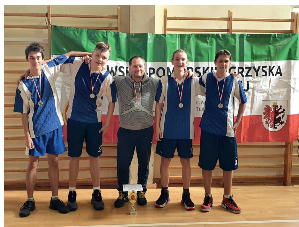
Koszykówka 3x3 Igrzyska Młodzieży Szkolnej Finał Wojewódzki, 03.10.2022