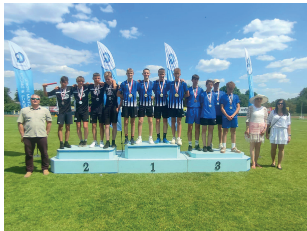
Lekkoatletyka Indywidualna IMS Dziewcząt i Chłopców, Świcie 7.06.2023