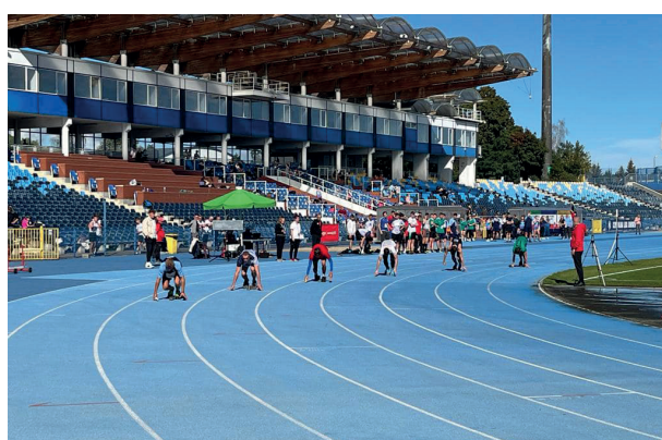
Festiwal sztafet 2022