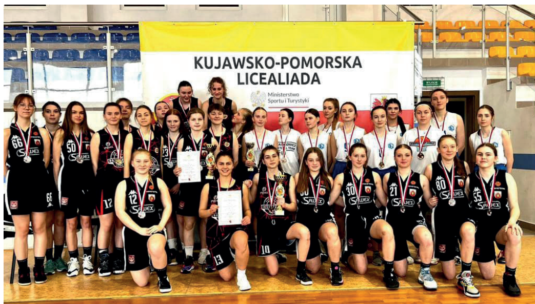
Licealiada Finał Wojewódzki Koszykówka Dziewcząt, Bydgoszcz 23.03.2023