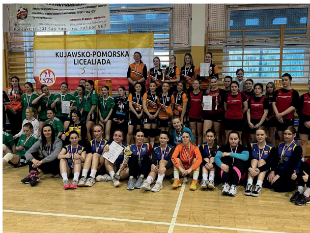
Licealiada Piłka Ręczna Dziewcząt, 26.01.2023 Bydgoszcz