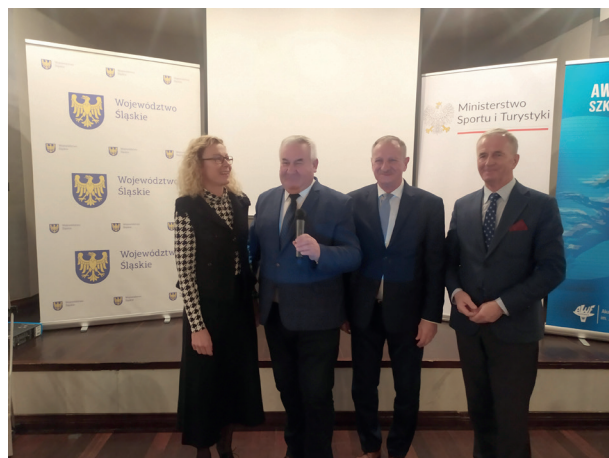
XVIII Ogólnopolski Sejmik Szkolnej Kultury Fizycznej 17-20.11.2022 Milówka