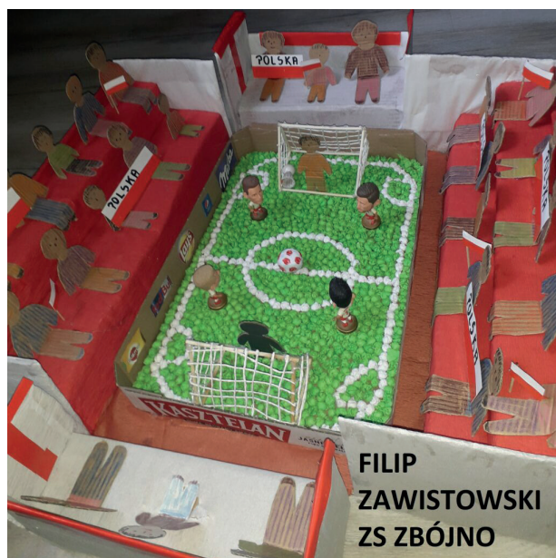
FILIP ZAWISTOWSKI ZS ZBÓJNO