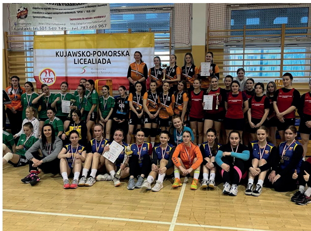
Piłka Siatkowa Finał Wojewódzki Licealiada/IMS dziewczęta, Bydgoszcz 2023