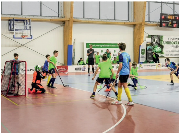
Unihokej ID, 16.12.2022 Pruszcz